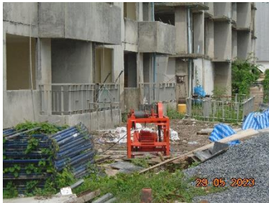
รูปที่ 2-8 พื้นที่วางเครื่องจักร