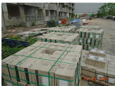
รูปที่ 2-5 พื้นที่เก็บกองวัสดุ