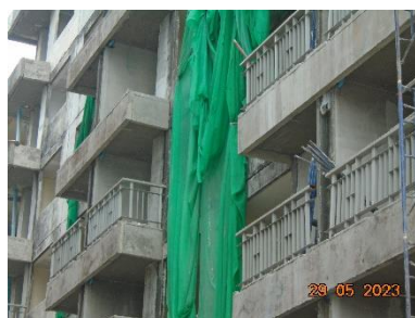
รูปที่ 2-4 แสลงปิดคลุมอาคารก่อสร้าง