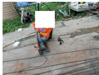
รูปที่ 2-13 การสวมใส่อุปกรณ์ป้องกันส่วนบุคคล