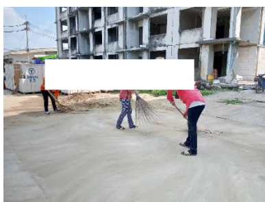
รูปที่ 2-18 การทำความสะอาดพื้นที่ก่อสร้าง