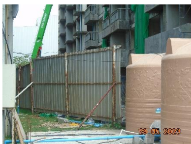
รูปที่ 2-1 รื้อชั่วคราวทึบ