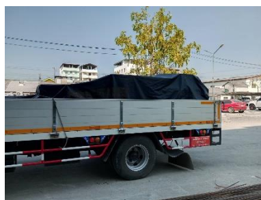
รูปที่ 2-2 รถบรรทุกวัสดุปิดคลุมท้าย