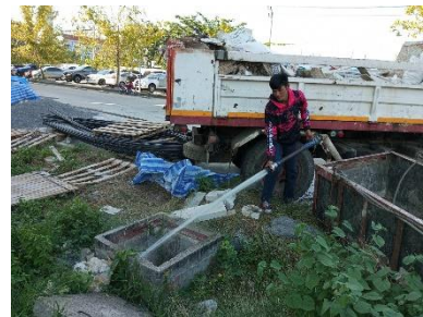
รูปที่ 2-11 รางระบายน้ำชั่วคราว