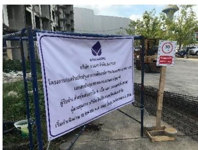
รูปที่ 2-3 ป้ายจำกัดความเร็ว