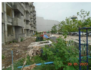
รูปที่ 2-6 พื้นที่รวบรวมเศษวัสดุที่เหลือจากการก่อสร้าง