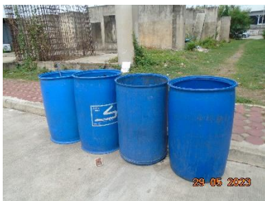
รูปที่ 2-12 ถังขยะมูลฝอยทั่วไป