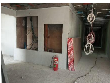
รูปที่ 2-14 ถังดับเพลิง