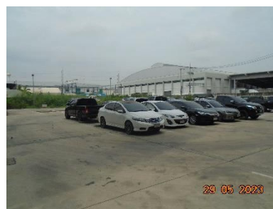
รูปที่ 2-17 พื้นที่จอดรถโครงการ