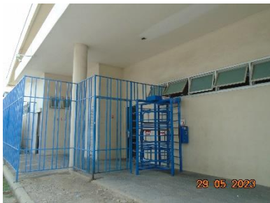
รูปที่ 2-10 ห้องน้ำ-ห้องส้วม