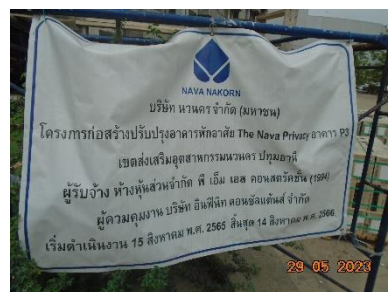
รูปที่ 2-15 ป้ายพื้นที่ก่อสร้าง