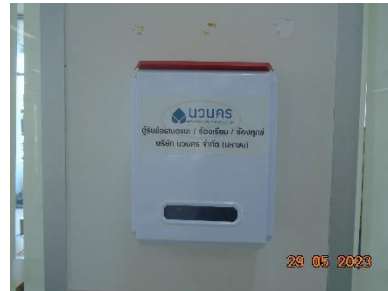
รูปที่ 2-9 กล่องแสดงความคิดเห็น