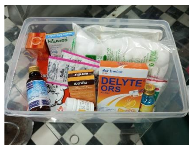
รูปที่ 2-19 กล่องปฐมพยาบาล