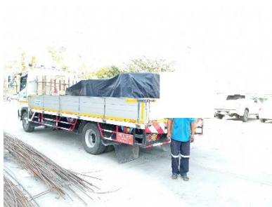
รูปที่ 2-16 พนักงานดูแลความสะอาดด้านการจราจร